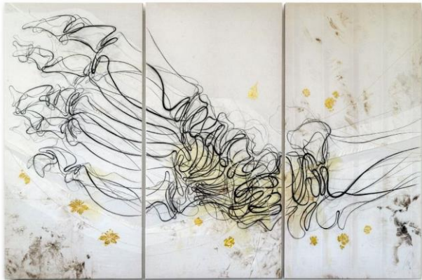
von Lilian Moreno Sánchez

Basis des Bildes ist ein Röntgenbild, das den gebrochenen Fuß eines Menschen zeigt, der in Santiago de Chile bei Demonstrationen gegen soziale Ungleichheit durch die Staatsgewalt verletzt worden ist.