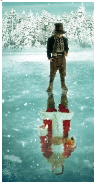
Bildrechte: freigegeben (Filmplakat)

Karten bitte direkt beim Filmforum besorgen.