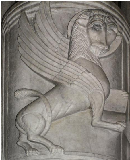
Der Löwe als Symbol des Evangelisten Markus

sche Botschaft bezeichnet, z. B. ein Sieg, eine geglückte Eroberung, der Herrschaftsantritt eines Kaisers. Im Alten Testament beim Propheten Jesaja ist damit die nahe Ankunft Gottes gemeint, eine befreiende Heilsbotschaft (Jes 52,7). An beides knüpft das MkEv an, wobei das Evangelium Jesu im völligen Kontrast zu Rom erscheint: Jesus, der Messiaskönig (= Christus), erobert nicht und beutet nicht aus, sondern heilt die Kranken, speist die Armen, sammelt das Volk und verkündet ihm Gottes Nähe: „Die Zeit ist erfüllt, das Reich Gottes ist da. Kehrt um, und glaubt an das Evangelium!“ (Mk 1,15)